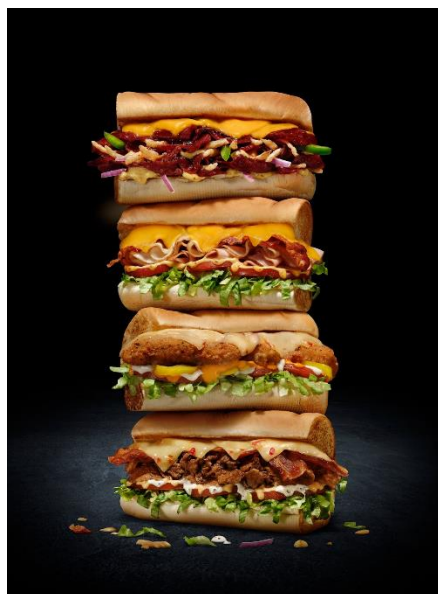
Brisket BBQ (n° 9), Grand Club de Subway (n° 2), Poulet Piquant (n° 4), Steakeurant (n° 8)